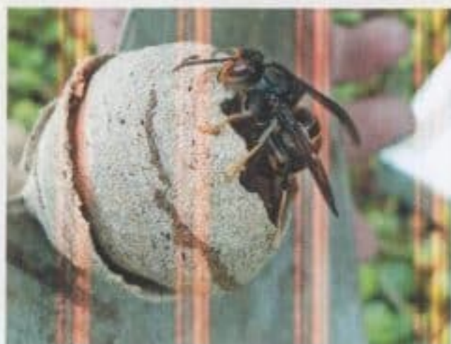
Nid primaire souvent à hauteur d'homme

Il faut absolument limiter le piégeage à ces périodes sinon les fondatrices vont pondre davantage pour compenser les pertes.